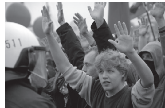
„Hands Up“ – starke Zeichen für Gewaltfreiheit.

Michael Rösch ist Mitglied im Jugendforum und Beirat in der Bistumsstelle Augsburg.