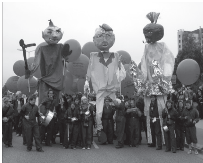
Widerstand – kreativ und phantasievoll.

Gewaltfreiheit ist nun zumal für Pazifisten in