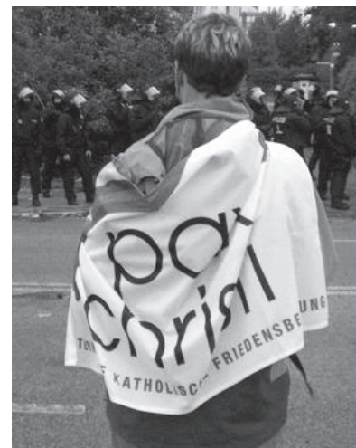
Keine Gegnerschaft, aber klare Positionierung.

Doch zwischen selbstverliebtem Rückzug und kriegerischer Weltverbesserung, (fast alle Kriege wurden damit legitimiert, die Welt zu verbessern) gibt es Grautöne zu beachten. Einer der bis heute viel zu der Frage beizutragen hat, wie die Welt gerechter gestaltet werden kann, ist Gandhi. Gandhi hat deutlichen Widerstand geleistet, wo er das als notwendig ansah. Dabei war ihm die Grundhaltung der Gewaltlosigkeit erstes Gebot. Er ist davon auch nicht abgewichen, als das britische Militär brutale Waffengewalt gegen streikende Bergarbeiter anwendete. Gegenüber zweifelhaftem