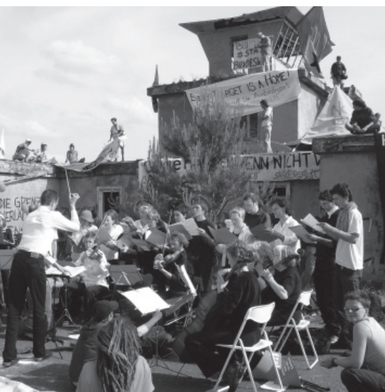
Hörbarer Protest des Lebenslaute-Orchesters.

Die Sichelschmiede ist eine Werkstatt für Friedensarbeit, die sich speziell für die Verhinderung des geplanten Luft-Boden-Schießplatzes engagiert. Sie ist die jüngste der zahlreichen Gruppen und Organisationen, die sich seit 1992 mit friedlichen Mitteln für eine Freie Heide einsetzen. Das besondere Profil der Sichelschmiede liegt darin, Strukturen, Kontakte und Kommunikationswege zu schaffen, die eine stärkere Präsenz der bundesweiten und internationalen Friedensbewegung im Konflikt um das Bombodrom zum Ziel haben. www.sichelschmiede.org