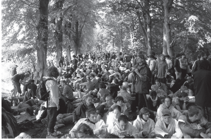
Friedliche „Wegelagerer“ blockieren die Zufahrtsstraßen nach Heiligendamm.