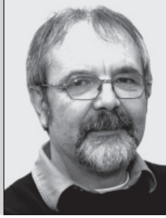
Gerold König