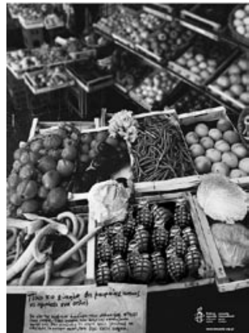
Keine Ware wie jede andere auf dem Markt.

Norwegens Forderung, Transparenz und Rechenschaftspflicht zu einem Grundpfeiler des Abkommens zu machen, erhielt im Saal viel Zustimmung. Eine Reihe anderer Delegationen betonte jedoch, angesichts herrschender „Berichtsmüdigkeit“ sollten den Staaten möglichst wenig zusätzliche bürokratische Bürden auferlegt werden. Die EU sprach sich in diesem Zusammenhang für „schlanke“ Rüstungsexportberichte aus, und auch Deutschland plädierte dafür, die Berichtspflicht in einem