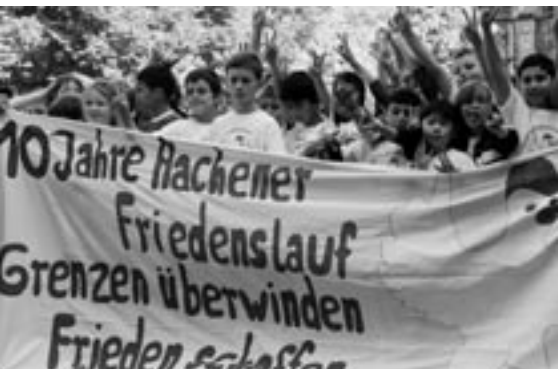
Mit Spaß und Fitness für den Frieden.