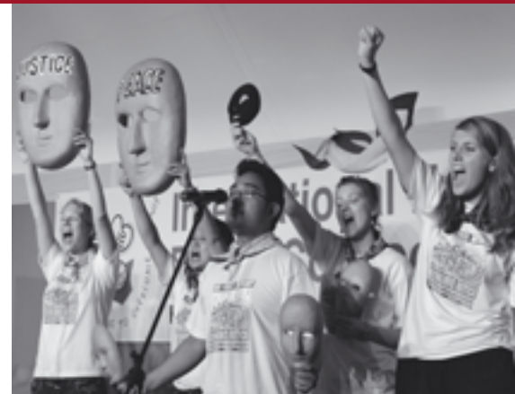
Freude und Fülle gab es zu erleben während der Tage in Jamaica.

gen der Feuerkraft sind als das zu entlarven, was sie bei Licht gesehen sind: ein Alptraum für die Menschheit, ob in Kinderspielen, als strategische Bedrohungsoption oder bereits wirklich gewordene militärische Praxis. Sagen wir es in ganz einfachen Worten: Gott will die (menschliche) Sicherheit aller Menschen! Wir müssen als ökumenische Bewegung also die verheerenden Konzepte „nationaler Sicherheit“ herausfordern. Wir müssen erkennen: Was die Existenz von Massenvernichtungswaffen all den davon betroffenen Seelen antut, ist Teil des grundlegenden Unwohlseins in der Welt von heute. ■