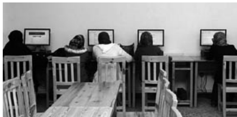
Per Mausclick zu Bildung und Ausbildung und damit zur Chance auf Selbstständigkeit.

Ihre afghanischen Mitarbeiterinnen wollten gerne eine Modenschau in westlichen Kleidern und Beiträge mit Schminktipp. Modenschau, so ein Quatsch, dachte die Journalistin zunächst. „Für uns ist das eine Revolution“, entgegneten ihr die Afghaninnen. „Wir dürfen uns schön machen.“ Das hat sie überzeugt. Manchmal fuhren sie auch zu Dreharbeiten übers Land. Besonders haften geblieben ist ihr ein Film über eine Frau, die mitten in der afghanischen Provinz einen Schönheitssalon betreibt. Mit einem kleinen Kredit zur Existenzgründung hatte die Afghanin sich Schminkutensilien besorgt und ihr Haus eingerichtet.