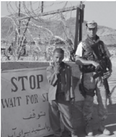
Ein klares Stopp dem Militäreinsatz.

„ Sie reden vom Frieden. Sie führen Krieg. “ – dieses Motto der Proteste gegen die zu erwartende Zwiespältigkeit der „Petersberg II“- Konferenz haben wir auch als Titel dieser Ausgabe der pax zeit gewählt, weil es im Oktober zehn Jahre sind, dass unter deutscher Beteiligung in Afghanistan Krieg geführt wird. Im Dezember lädt die Bundesregierung erneut zu einer Afghanistankonferenz nach Deutschland ein. Ich gehöre zu denen, die zu Protesten anlässlich dieser Konferenz aufrufen. Denn dort wird viel von der „Übergabe in Verantwortung“ gesprochen, aber zugleich die weitere militärische Präsenz „des Westens“ über das Jahr 2014 hinaus vorbereitet werden. Dass auch Deutschland mit Soldat/innen über 2014 hinaus in Afghanistan präsent bleiben will, hat die Bundeskanzlerin bereits anlässlich des Nato-Gipfels 2010 in Lissabon verkündet. Das kann auf den Internetseiten der Bundesregierung nachgelesen werden. Nun will ein breites Bündnis der Friedensbewegung nicht zulassen, dass genau das aus dem öffentlichen Bewusstsein – und der Berichterstattung – verschwindet. Deshalb organisieren wir den Protest in Bonn Anfang Dezember und bitten Euch alle um Beteiligung in Bonn – das wäre das Beste! – oder durch dezentrale Aktivitäten. Alle wissen es: Die Sicherheit für die afghani-