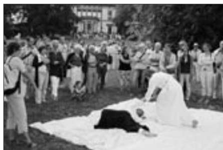
Mitmachen war gefragt beim Fest der Friedensräume.

machte. Der Hörsinn wurde musikalisch beispielsweise durch die festlichen Klänge der Lindauer Bläser, durch das pax christi-Trio, durch Friedens- und Protestlieder oder durch einen Gospelchor angeregt. Texte von Erich Kästner bis Erich Fried regten zum Nachdenken an. Mitmachen hieß es dann bei einem Trommelworkshop, bei einer Einführung in die Friedenskampfkunst Aikido oder beim Basteln an Laternenbooten, die später von Kajaks leuchtend über den See gezogen wurden. Dazwischen unterhielten ein Zauberer sowie herumstreuende Clowns die Flaneure am Bodenseeufer. Und neben kulinarischen Genüssen wie etwa dem Besuch bei einer Kaffee-Riksha, hatten Neulinge die Möglichkeit, die Friedensräume selbst kennen zu lernen, die Ausstellung ‚Friedenstauben‘ zu bestaunen oder die Geschichte des Lindenhofparks zu erfahren.