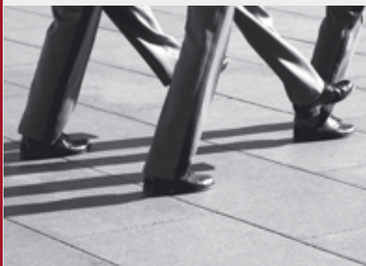
Kriegsdienstverweigerung bleibt ein Thema auch in Berufsarmeen.