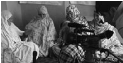
Mit der Kamera dicht an den Menschen und ihrem Alltag.