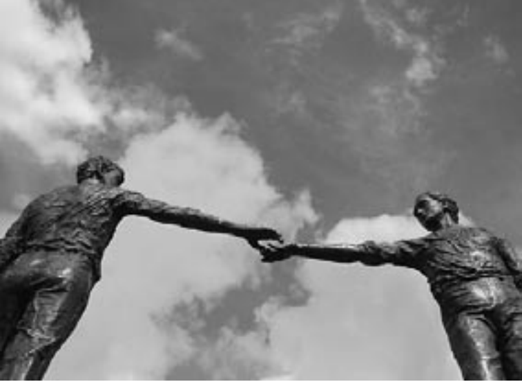
Nur Versöhnung und Dialog weisen in eine Zukunft ohne Terrorismus.

denen die Dividenden für die Aktionäre wichtiger sind, als zum Beispiel preisgünstige Medikamente gegen AIDS oder andere Krankheiten, haben bedeutend mehr Tote auf ihrem Gewissen, als viele Terroristen zusammen. Darüber schweigen unsere Medien.