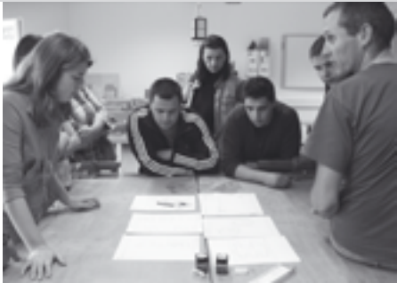
Erfahrungsaustausch mit einer Caritas Jugendinitiative.

Aufenthaltes, den die Südosteuropäer/innen im Gemeindezentrum der Pfarrei Mariä-Himmelfahrt in Frankfurt-Griesheim verbrachten, lernten sie die Möglichkeiten des Politischen Aktionstheaters kennen, besuchten das Schüler/innen-Café Müller der Katholischen Studierenden Gemeinde und deren Mädchentreff