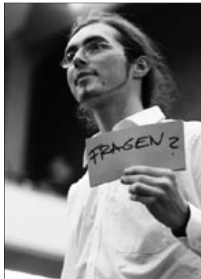
„Der Vorhang fällt und viele Fragen offen.“

Diese Wachstumskritik ist zugleich eine radikale Konsumkritik. Es geht um „Entrümpelung“ und darum, welchen Wohlstand, insbesondere in Form von echter Lebenszeit, wir gewinnen, wenn wir den Verwertungs- und Konsumimperativen des Kapitals den Gehorsam verweigern.