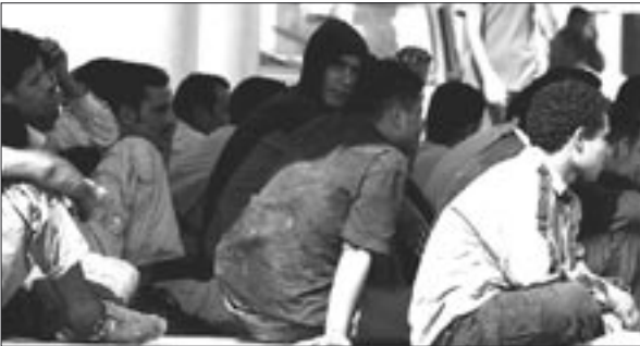
Europas Menschenrechtspolitik auf dem Prüfstand: Tausende Flüchtlinge warten auf Schutz und Aufnahme.