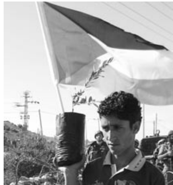
Stolz auf den gewaltfreien Protest in 20 Orten.

Die Anerkennung des Staates Palästina im September ist wichtig. Es gibt Anzeichen in EU Staaten für die Anerkennung Palästinas. Unsere Besuche zielen darauf ab, z.B. durch Kampagnen in Italien, dass sie unseren Staat anerkennen. Ich hoffe, dass Sie auch Druck auf ihre Regierung ausüben, damit sie unseren Staat anerkennen. Man kann auch Druck auf Israel ausüben durch Boykott und Stopp von Investitionen. Es gibt bei uns ein Sprichwort: Unterstütze deinen Bruder sei er im Recht oder im Unrecht. Das muss erklärt werden. Es bedeutet: Hilf ihm, damit er aus dem Unrecht zurückkehrt. Ich weiß, wie tief die Beziehungen zwischen Israel und Deutschland sind. Sie müssen Israel unterstützen, damit es aufhört,