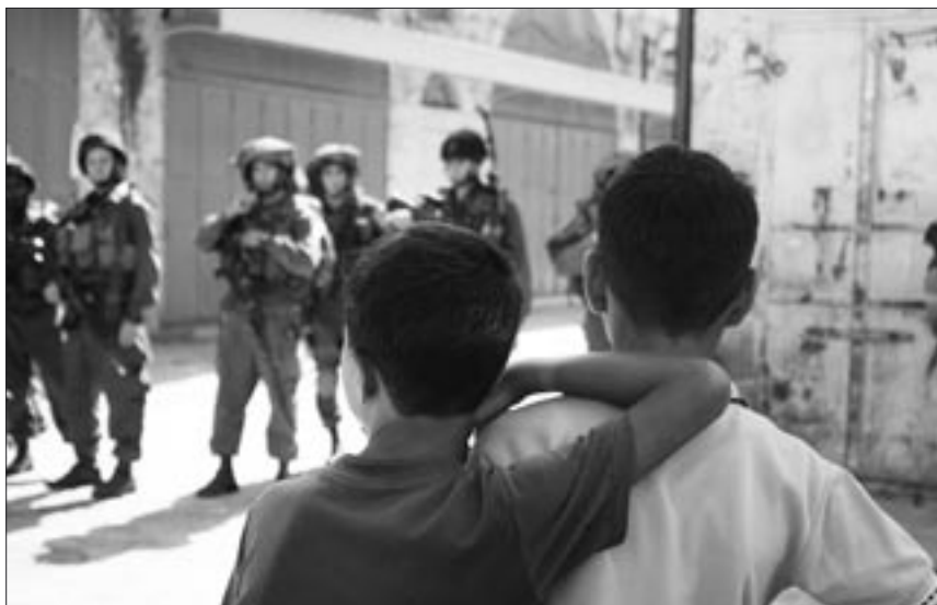
Soldaten demonstrieren ihre Macht auch in Gegenwart von Kindern und Jugendlichen.

Ab 2009 begann die Aktivität gegen die Mauer stärker zu werden. Deswegen haben die Angriffe gegen die Aktivist/innen zugenommen.