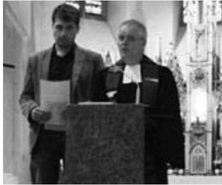
Biblische Besinnung und politisches Information beim Nachtgebet.

Mit einer Informationsveranstaltung in der Katholischen Hochschulgemeinde (KHG) Edith Stein sowie mit einem Ökumenischen Politischen Nachtgebet in der Kirche St. Martin am Rathausplatz hat pax christi in Freiburg auf die „Aktion Aufschrei – Stoppt den Waffenhandel“ und damit auf die deutschen Rüstungsexporte und deren Folgen aufmerksam gemacht. In seinem Vortrag an der KHG erläuterte der Freiburger Friedensaktivist und Rüstungs-