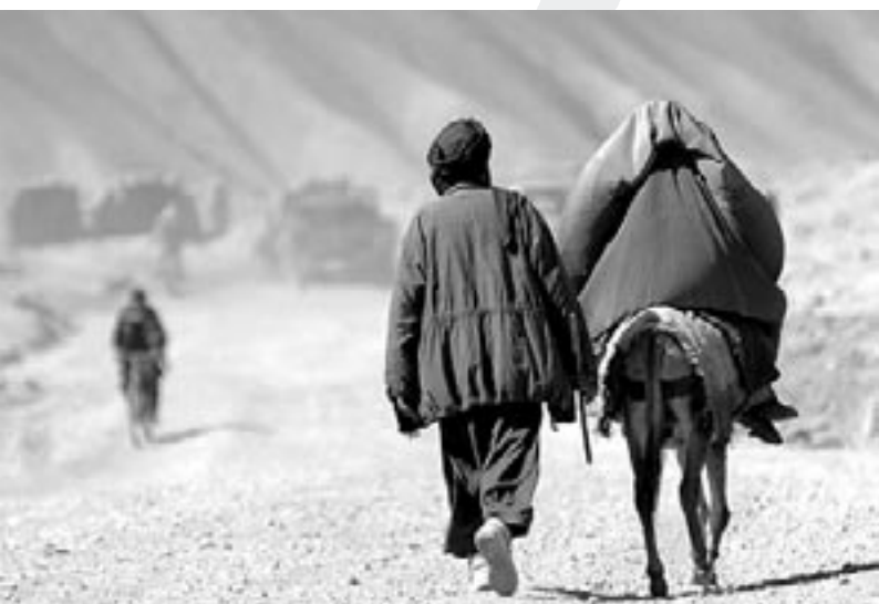
Kriege nehmen Menschen ihre Heimat. Nur Frieden öffnet den Weg zurück.

Nach der Weltgesundheitsorganisation sind darunter 151.000 Zivilisten und 5.000 US-Soldaten gewesen. Wir sollten hier aber auch noch die vielen Millionen Menschen dazunehmen, die deshalb elend sterben, weil ihnen eine egoistische Politik vieler reicher Länder Nahrung und medizinische Versorgung verweigert. Große Pharmaunternehmen,