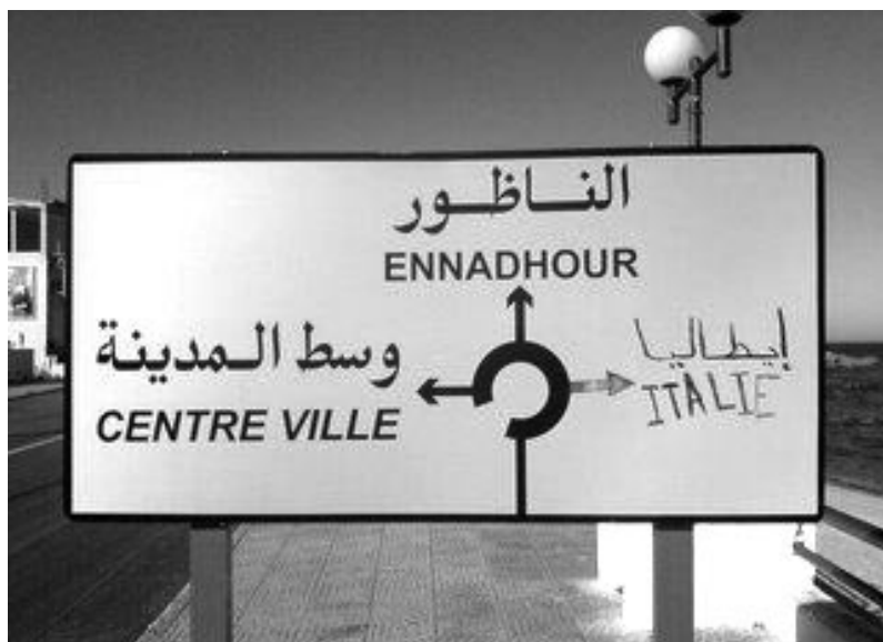
Ein Abzweig Richtung Hoffnung.

Immerhin: Die EU-Kommissarin beschrieb in ihrem Blog im Oktober 2010, dass sie nach Gesprächen mit inhaftierten Flüchtlingen in