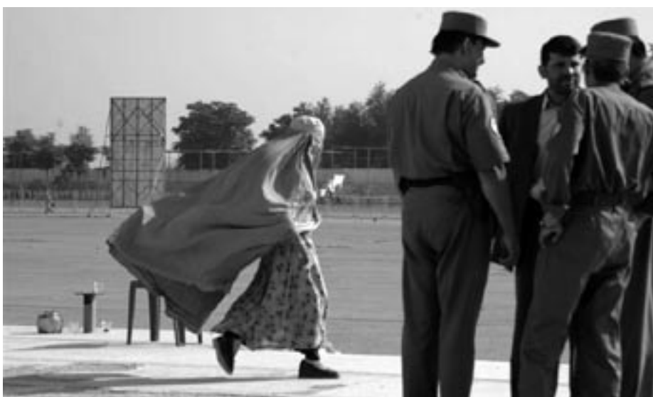
Frauen in Afghanistan: ihre Kompetenzen werden gebraucht, ihr Platz in der Gesellschaft ist umstritten.

zeigt, sei so weit weg vom Leben in Afghanistan, dass es großen Widerstand hervorrufe. Die Vorstellung, dass sich Frauen zum Beispiel einfach scheiden lassen, macht vielen einfachen Menschen Angst. „Das geht einfach zu schnell.“ Am Versuch einer forcierten Modernisierung sind schon die Russen gescheitert, als sie die Mädchen unter Polizeischutz zur Schule brachten.