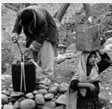
Die Versorgungssituation in Afghanistan hat sich stark verschlechtert.

Heute, zehn Jahre nach der ersten Petersberger Konferenz, hat die von den Taliban dominierte Aufstandsbewegung weite Teile des Landes er-