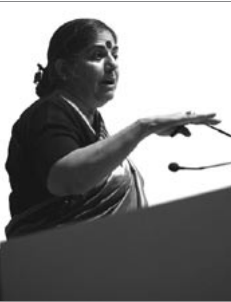
Die indische Umweltaktivistin und Mitglied des Club of Rome Vandana Shiva.

Das das globalisierungskritische Netzwerk ATTAC ausdrücklich die Auseinandersetzung um das Wachstumsthema führt, ist ein Zeichen der theoretischen Stärke und Lebendigkeit dieser Bewegung. In der praktischen Arbeit drängte sich mehr und mehr die Einsicht auf, dass die Vorschläge zur Regulierung der Finanzmärkte einer Therapie der Symptome gleichkommen. Der Zwang zur Kapitalakkumulation auf immer höherer Stufe, der immer deutlicher an seine immanenten und externen (physikalischen) Grenzen stößt, ist die eigentliche Krankheitsursache. ATTAC hat sich dieser Diagnose mutig und fachkundig gestellt.