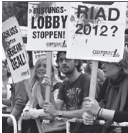
Mit vielen Aktionen gegen den Export von Terror und Gewalt made in Germany.

3. Der erste Satz des Artikel 26, Absatz 2 Grundgesetz bleibt bestehen. Jedoch wird der sich daran anschließende Satz „Das Nähere regelt ein Bundesgesetz“ dahingehend klargestellt, dass es sich dabei einzig um das Kriegswaffenkontrollgesetz handelt. Der damalige Verteidigungsminister Strauß war die treibende Kraft dafür, dass 1961 ein Systembruch stattfand, indem trotz der Vorgabe „regelt ein Bundesgesetz“ de facto zwei Gesetze gemacht wurden: Für die Produktion und den Transport von Kriegswaffen und Rüstungsgütern innerhalb Deutschlands wurde das sehr strenge Kriegswaffenkontrollgesetz erlassen und für den Export der gleichen Güter das sehr laxe und dem freien Welthandel dienende Außenwirtschaftsgesetz. ■