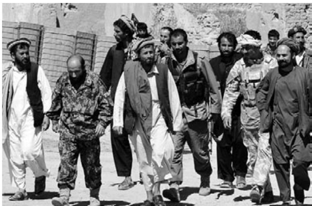
Eine Lösung des Afghanistankonflikts geht nur über Gespräche mit Aufständischen – und damit auch der Taliban.

Otmar Steinbicker, Herausgeber des Aachener Friedensmagazins aixpaix.de