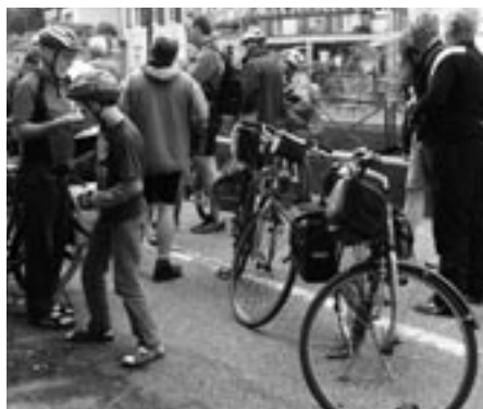
Gemeinsam unterwegs auf Friedenswegen.

Zum zehnten Mal haben die pax christi-Bistumsstellen Limburg, Fulda und Mainz eine Fahrradrouten „Friedenswege“ durchgeführt. Nachdem es zuletzt durch die Rhön ging, stand in diesem Jahr eine Spurensuche im