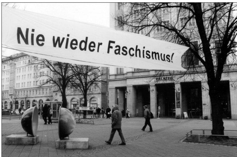
Für das Jahr 2004 verzeichnet das Bundesinnenministerium 8,4% mehr Straftaten mit rechtsradikalem Hintergrund – ein Grund mehr, deutliche Zeichen des Protests zu setzen. (BMI vom 9. 5. 2005)