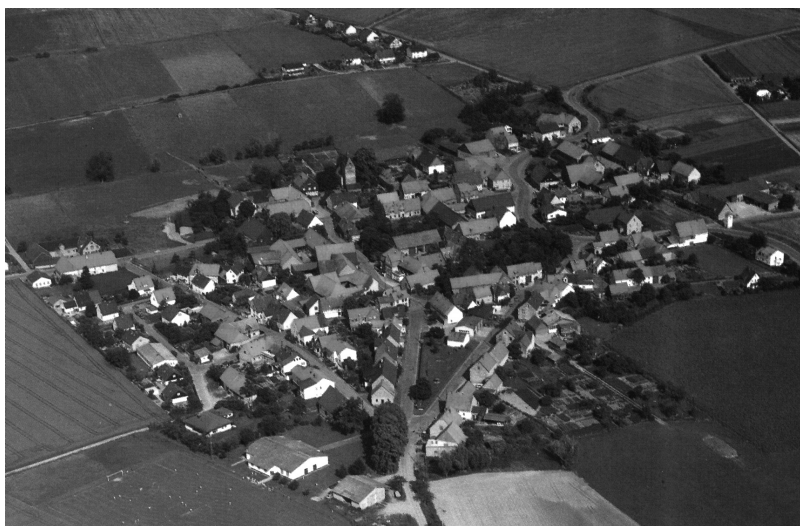
Der ländliche Raum: keine „rechts-freie“ Idylle.