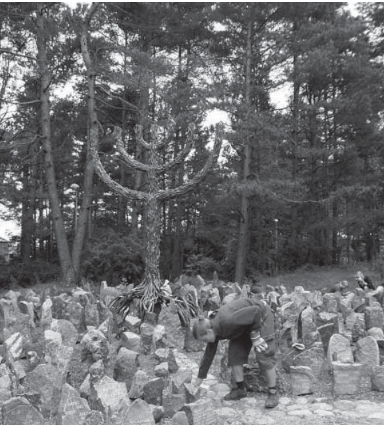
Eindrücke, die über den Tag hinaus bleiben und in vielerlei Form verarbeitet wurden.

was denn wohl, möchte ich empört über diese ungeheure Verharmlosung dazwischenrufen). Das ist zu allgemein gesagt und viel zu sehr verharmlosend. Erinnerung an die Opfer heißt auch: sich ihrer Qualen zu erinnern. Wir haben das getan.