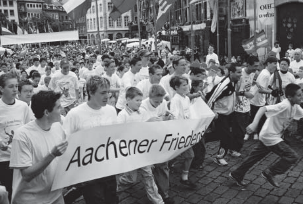
Auf los geht's los!