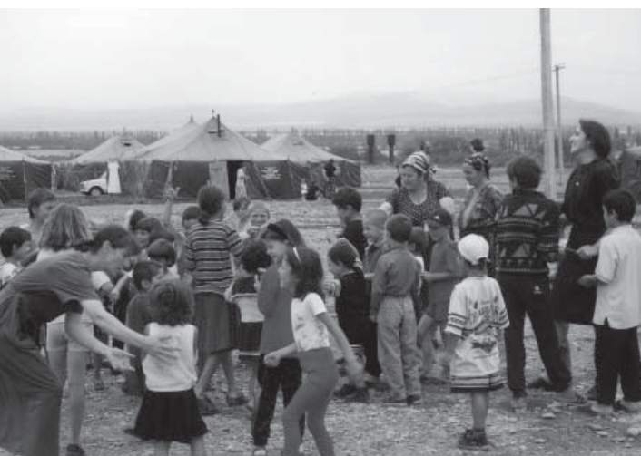
Freude vermitteln im Flüchtlingsalltag. Spielen als Weg aus der Angst und der Traumatisierung.