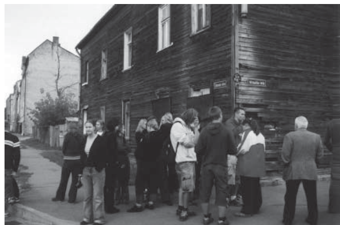
Die Horrorwelt des Rigaer Ghettos wurde durch die Schilderungen eines Zeitzeugens begreifbar.