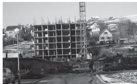
Im Mai 2005 sollen die ersten Bewohner einziehen können in das Altenheim in Zenica.