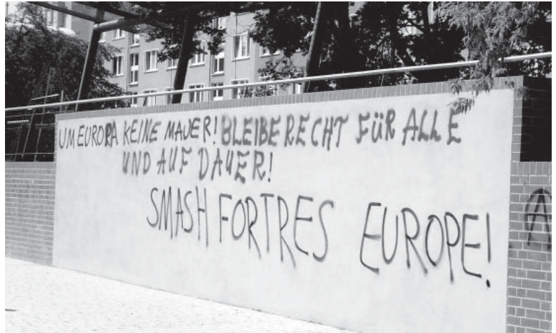
Apell für ein Europa der offenen Grenzen.