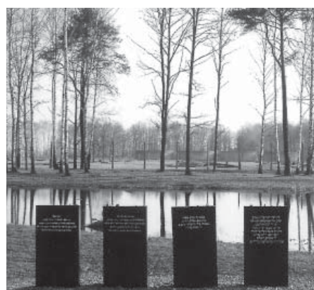
Auschwitz II – Birkenau. In diesen Sumpf wurde die Asche der in den Krematorien verbrannten Leichen geschüttet.

Dieses Bekenntnis wollen wir, Mitglieder des Präsidiums der deutschen Sektion von pax christi, heute bekräftigen. Und wir ergänzen: Nichts gibt es, keinen Unterschied in der Herkunft, Nationalität, Religion oder Weltanschauung, keine Idee, kein Ziel und auch sonst nichts, das eine Ausgrenzung, Entwürdigung oder Verfolgung von Menschen rechtfertigen könnte. Die Stätten der Vernichtung hier in Polen und anderswo sind eine ständige Mahnung an uns, all unsere Kraft für die Verständigung und Versöhnung einzusetzen.