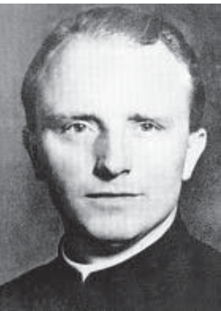
Franz Stock: ein Wegbereiter der deutsch-französischen Versöhnung.

Am 22.8.2004 fand anlässlich des 100. Geburtstages von Franz Stock auf dem Borberg bei Brilon eine Friedenswallfahrt unter Mitwirkung von pax christi statt.