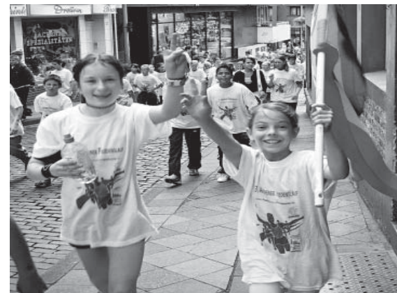
Dieser Lauf kannte nur Siegerinnen und Sieger.