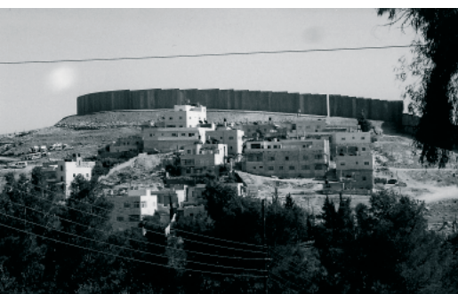
Die Mauer bei Jerusalem.

Mit freundlichen Grüßen Gruppe „Aktuelle Politik“