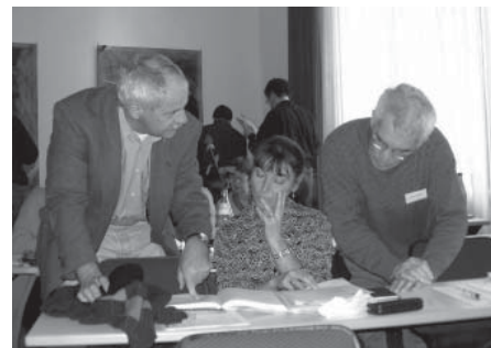
Die Delegierten hatten weitreichende Entscheidungen zu treffen.

Die Bistumsstelle Bamberg setzte ergänzend noch in einem weiteren Antrag die Forderung durch, „nach Partnern im Bereich der sozialen Bewegungen zu suchen, mit denen sich Alternativen zu den Bereichen Friedenspolitik, soziale Sicherung und demokratische Partizipation in der EU-Verfassung formulieren lassen“.