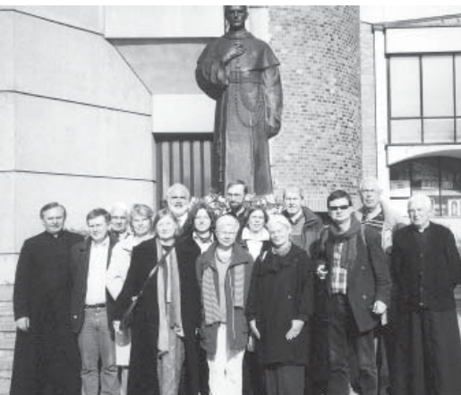
Die Delegation mit Gastgebern vor der Maximilian-Kolbe-Kirche in Oswiecim nach dem gemeinsamen Gottesdienst.